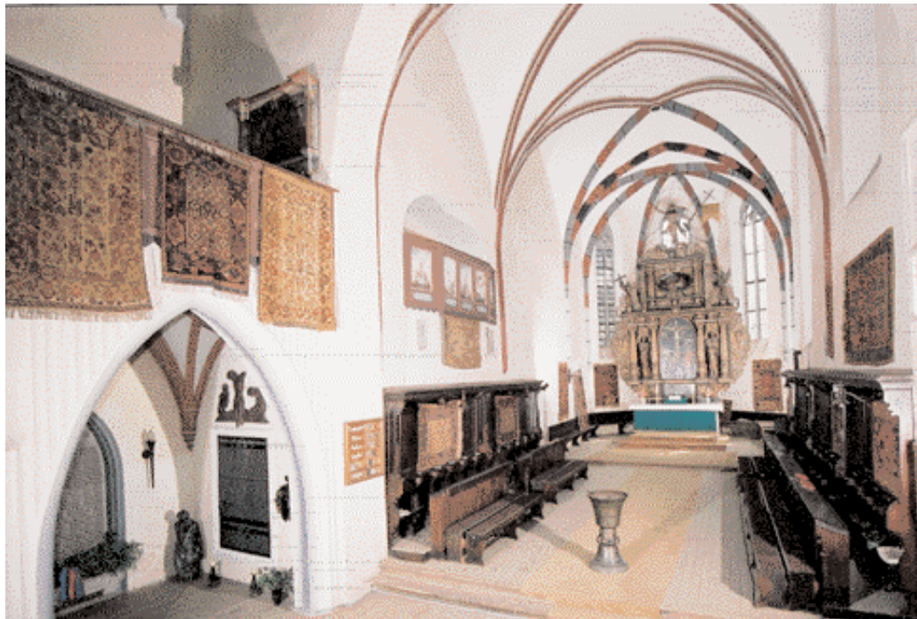
Covoare Ushak, "Lotto", Selendi și "de Transilvania" în Biserica Mănăstirii din Sighișoara

folosiți în literatura română de specialitate cu cei validați astăzi pe plan internațional. Cine o va parcurge va învăța să facă distincția între o serie de covoare "clasice" turcești, precum cele denumite „Bellini”, „Crivelli”, „Ghirlandaio”, „Holbein”, „Lotto”, „Memling”, „Tintoretto” etc. Numeroase alte detalii oferă, la rândul lor, puncte de sprijin importante aceluia care dorește să "citească" în profunzime un covor.