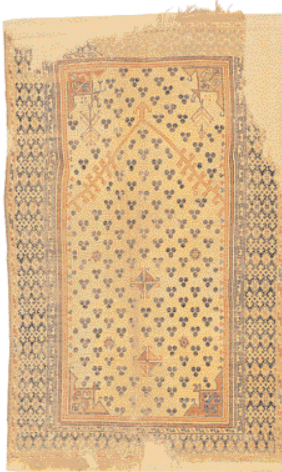
Covor de rugăciune "Chintaman" - Selendi, Anatolia de Vest

paginile 174-175 (autor: Radu Olteanu), ce indică localitățile transilvănene în care s-au păstrat cele mai multe dintre aceste piese excepționale, capitolul poate fi privit, în egală măsură, ca un ghid indispensabil și ca o invitație adresată cititorilor de a merge să vadă in situ splendidele creații textile realizate în veacurile XV-