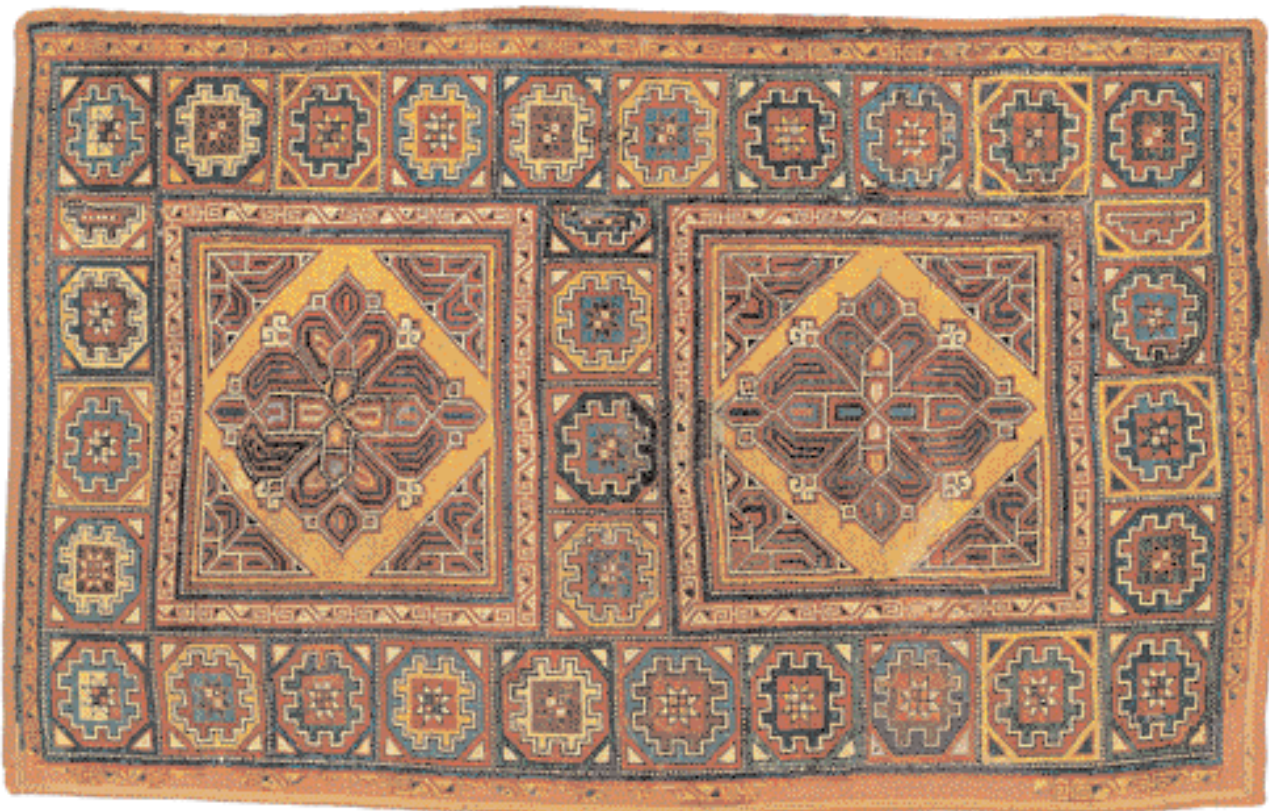
Covor 'Ghirlandaio' - Anatolia de Vest

Capitolul II - Transilvania și covoarele turcești , realizat de de A. Kertesz cu sprijinul mai multor specialiști, clarifică importanta problemă a provenienței covoarelor otomane