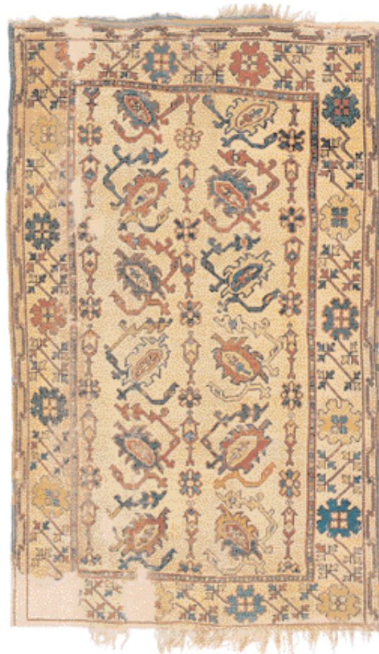
Covor "cu scorpioni" - Selendi, districtul Uşak, Anatolia de Vest

Sec. XVII, 120 x 183 cm, 840 noduri/dm 2 Este un covor "cu păsări" (motive care, în pofida denumirii, sunt de inspirație vegetală) din familia covoarelor albe. Bordura cu nori stilizați (așa-numita cloud-band ) reia un motiv de proveniență chineză. BISERICA SF. MARGARETA, MEDIAȘ, inv. 503