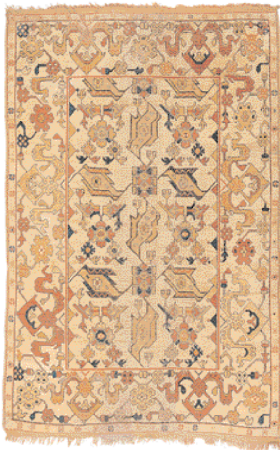
Covor "cu păsări" - Selendi, districtul Uşak, Anatolia de Vest

Covoare otomane în corul Bisericii Sf. Margareta din Mediaș. A doua ca importanță din Transilvania, aceasta este colecția cea mai bogată în piese timpurii, între care și patru covoare "Holbein". Cu ocazia fotografierii, toate covoarele au fost spălate, tratate și reponzionate.