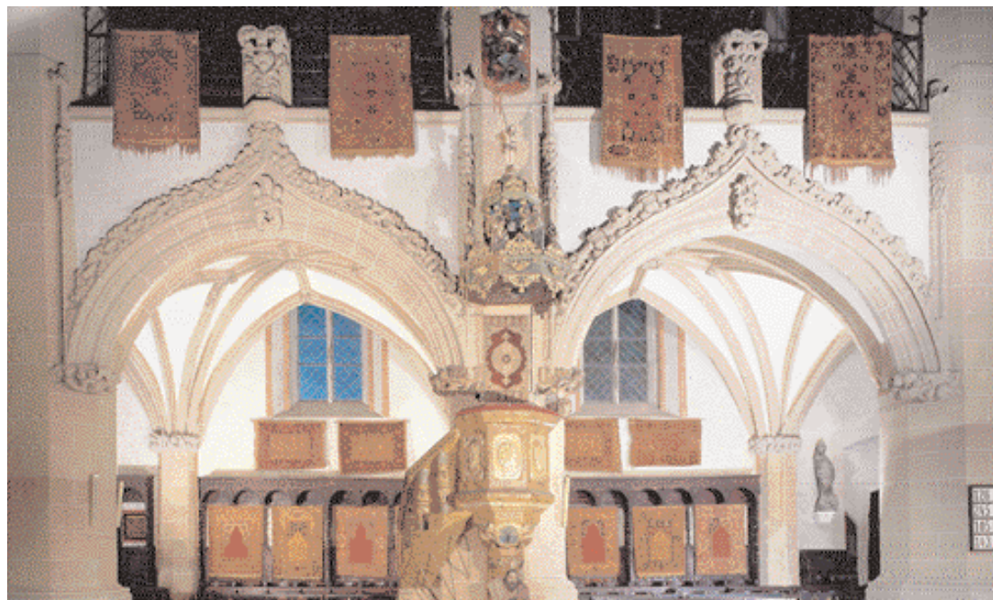
Amvonul Bisericii Negre din Braşov, flancat de o varietate de covoare otomane. Aici sunt expuse peste 100 de piese anterioare sec. XIX. În vederea fotografierii - efectuată în incinta Bisericii, în condiții profesionale -, toate covoarele au fost spălate.