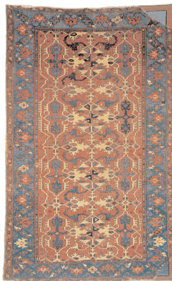
Covor "Lotto" - Ushak, Anatolia de Vest

Sfârșitul sec. XVI, 123 x 204 cm, 2880 noduri/dm 2 Este unul dintre puținele covoare de secol XVI din impunătoarea colecție a Bisericii Negre, al cărei interior (inclusiv covoarele) a fost distrus în întregime de incendiul din 1689 BISERICA NEAGRĂ, BRAȘOV, inv. 173