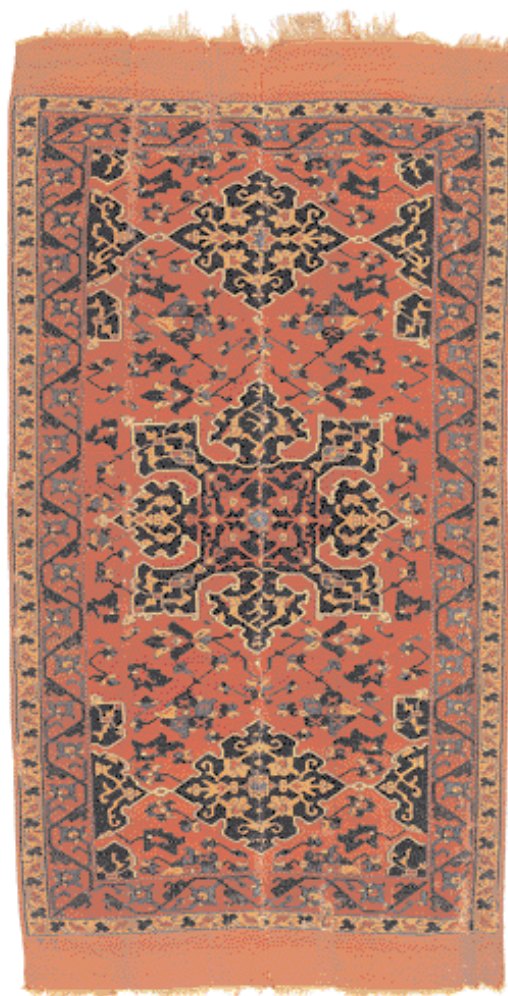
Covor Ushak "cu stea"- Anatolia de Vest

Sfârșitul sec. XVI, 123 x 204 cm, 2880 noduri/dm 2 Este unul dintre puținele covoare de secol XVI din impunătoarea colecție a Bisericii Negre, al cărei interior (inclusiv covoarele) a fost distrus în întregime de incendiul din 1689 BISERICA NEAGRĂ, BRAȘOV, inv. 173